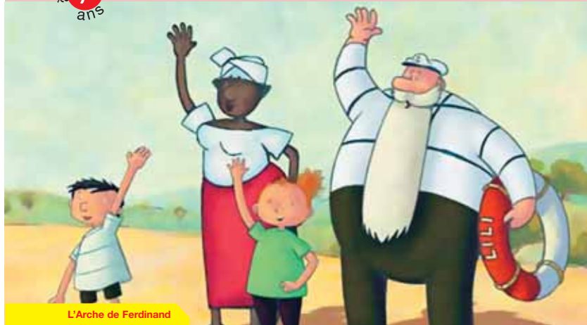
L'Arche de Ferdinand